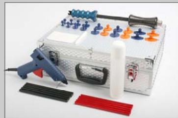
WP6170 WPT Schlaghammer Standard-Satz