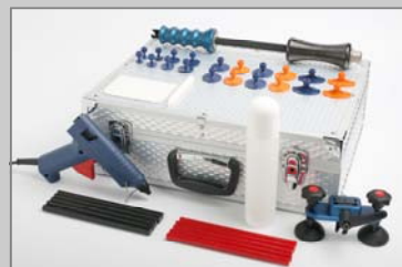
WP6180 WPT Dent Puller Kombi-Satz