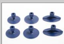
Klebe-Adapter 35, 40, und 50x30 mm