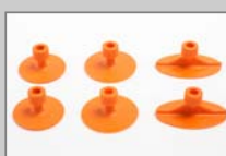
Klebe-Adapter (verformbar) 35, 40, und 50x30 mm