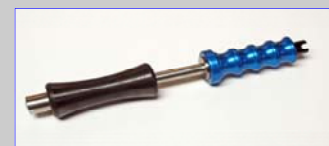
Artikel-Nr. 6138 Schlaghammer