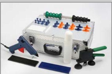
TW6080 TwenTec Dent Lifter Kombi-Satz