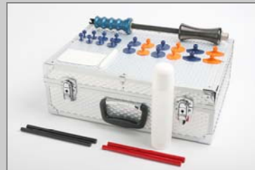
WP6160 WPT Schlaghammer Intro-Satz