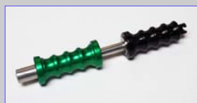
Artikel-Nr. 6038 Dent Hammer