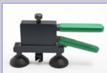
Artikel-Nr. 6013 Dent Lifter

Fixierlampe mit Saugfuß und Flexarm, 220 Volt, Modell DL