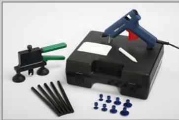
TW6020 TwenTec Dent Lifter Economy-Satz