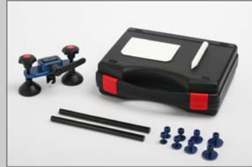
WP6110 WPT Dent Puller Intro-Satz