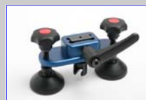
Artikel-Nr. 6122 Dent Puller