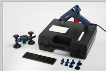
WP6120 WPT Dent Puller Standard-Satz