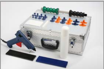
TW6070 TwenTec Dent Hammer Economy-Satz