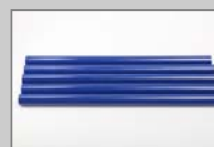
Klebestangen, Heavy Duty-Extra