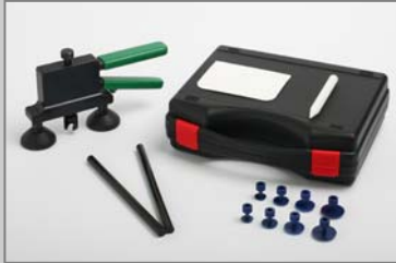
TW6010 TwenTec Dent Lifter Basis-Satz