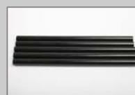
Klebestangen, Heavy Duty