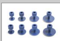
Klebe-Adapter 15, 20, 25 und 30 mm