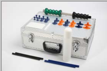
TW6060 TwenTec Dent Hammer Basis-Satz