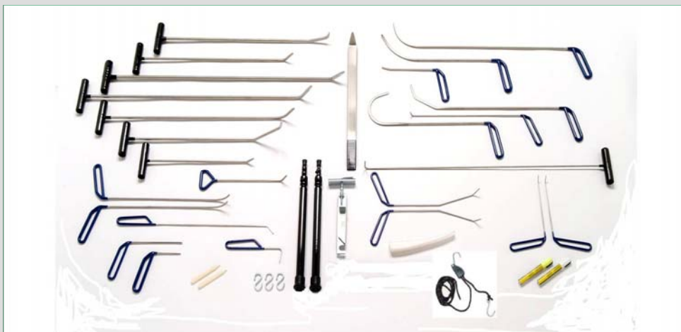
Master Kit (26 Tools + Toebehoren)