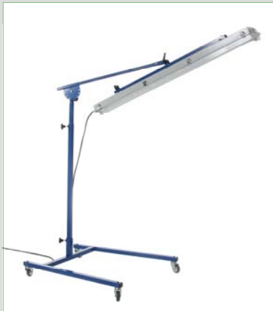
Art.nr. 6502 Multifunctionele TL-Lamp met Statief, 220 Volt