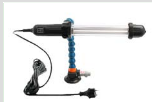
Art.nr. 6538 Mini-Light met Zuignap- bevestiging, 220 Volt