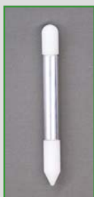
Art.nr. 5321 Vario-Tip Punch