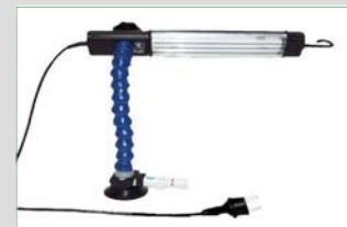
Art.nr. 6548 Dent-Light met Zuignap- bevestiging, 220 Volt