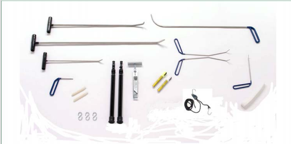
Basis Kit (8 Tools + Toebehoren)