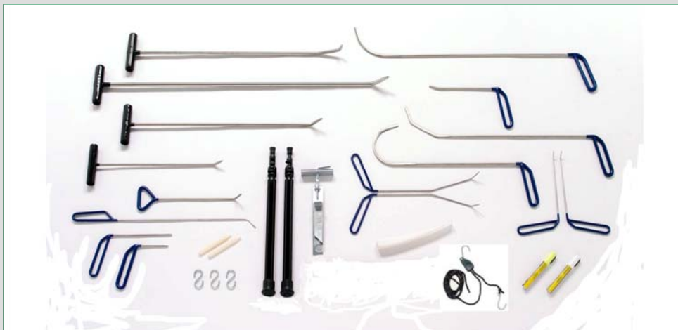
Custom Kit (16 Tools + Toebehoren)