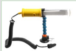
Art.nr. 6535 Stubby Light met Zuignap- bevestiging, 12 Volt